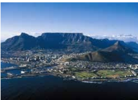
Table Mountain หนึ่งใน 7 wonders of the world

กลับมาหน่อยยังมี Designer Craft Market ที่เต็มไปด้วยของที่ระลึกสวยๆ Creative Style Africa โดย designers and artists อีกด้วย