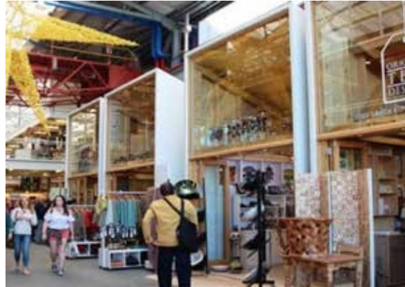
Designer craft market

16.00 ท่านสามารถแวะ Diamond Museum แอฟริกาใต้เป็นประเทศส่งออกเพชรอันดับต้นๆของโลก มาดูกันว่าทำไม “แหวนต้องใส่นี้นางข้างซ้าย” หรือว่าทำไม “เพชรต้องตัดก็เหลี่ยมถึงเปล่งประกายที่สุด” เรียนรู้เรื่องราวของเพชรที่มีชื่อเสียง