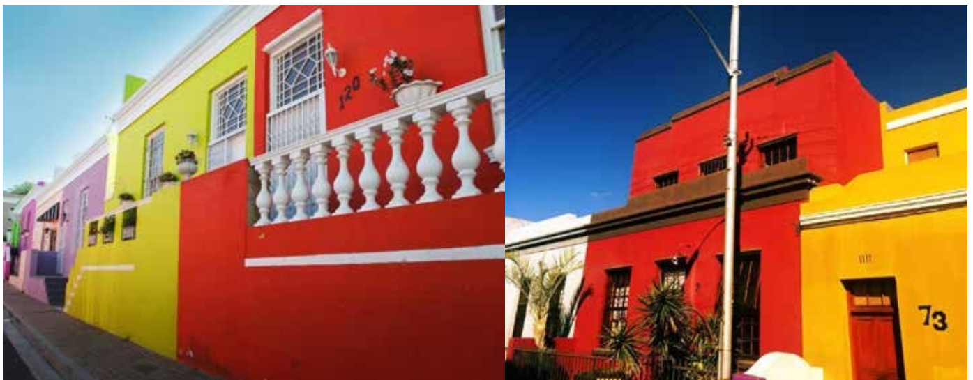
Colorful Muslim neighbourhood

18.00 รถรับส่งมารับเพื่อกลับไปพัก ท่านสามารถเดินจากที่พักมารับประทานอาหารได้ตามใจชอบมีให้เลือกมากมายค่ะ /รถพาไป Dinner แล้วมาส่งกลับที่พัก