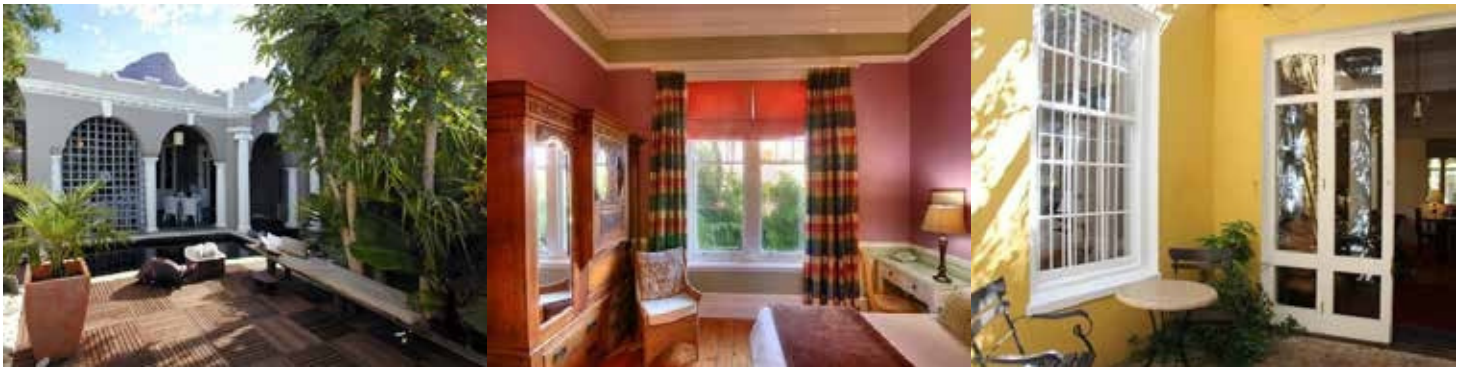
Boutique B&B หนึ่งใน list ของเรา

11.00 เข้าที่พัก B&B Boutique Cottage หรือ 3 stars ที่มีคามยูนิคเฉพาะตัวที่เราเลือกสรรมาให้ (สามารถปรับเปลี่ยนดาวได้ถ้าต้องการพัก 4-5 ดาว)