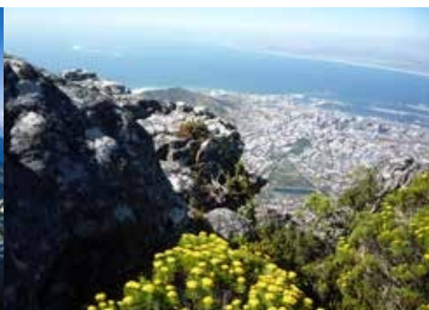
Proteas สายพันธ์ต่างๆบน Table Mountain