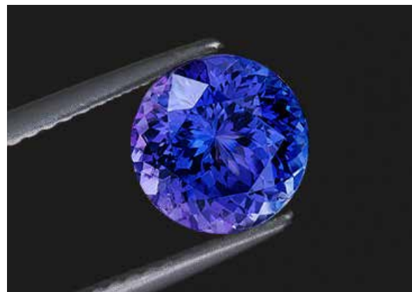
Tanzanite, South african's gem