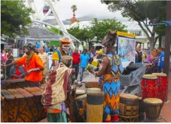
African street show