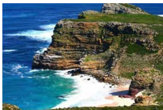
Cape of Good Hope