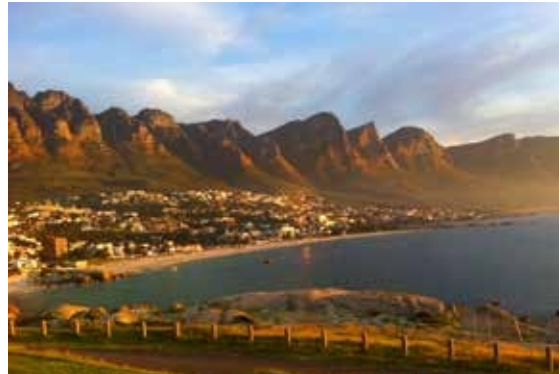
Camps Bay Beach